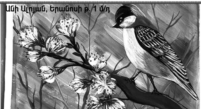
Անի Արյան, Երանոսի թ. 1 մ/դ

Մաթեմատիկայի հանրապետական օլիմպիադայի եզրափակիչ փուլին ԿԳ Նախարարության կողմից Գովասանագրով պարգևատրվեց Վարդանի միջնակարգ դպրոցի 6-րդ դասարանի աշակերտ Գագիկ Պետրոսյանը: Վերջինս հրավեր է ստացել Ֆիզմաթի հատուկ դպրոցում ուսումը շարունակելու: Մաղթում ենք հաջողություններ: