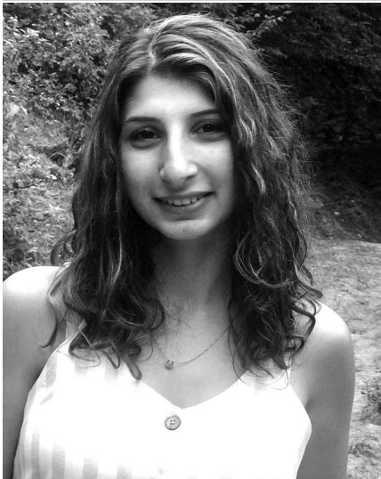
Պատասխանատվության մասին թեման մենք ձեզ հետ քննարկել ենք,

բայց կարծում են՝ ավելորդ չի լինի, եթե այլ անկյունից դիտարկենք այս հարցը: Պատասխանատվությունը պարտականություն է. պետք է պատասխանատու լինես քո արարքի, որոշումների ու քո հետագա քայլերի համար: