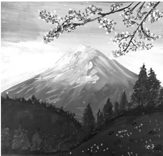
Մարուսյա Սանասարյան, Երանոսի ք.1 մ/դ.

Հաճախակի մենք տրվում ենք երազանքներին: Օրինակ, երբ նայում ենք աշխարհահռչակ սցենարիստների ու ռեժիսորների կողմից նկարահանված կատակերգությունները, մենք հիանում ենք դերասանների խաղով, ովքեր յուրաքանչյուր ժեստ, կատակ կամ խոսք կարողանում են հաղորդել, փոխանցել մեզ իրենց խաղի, միմիկայի, խոսքի, տեսքի և այլ միջոցներով: Մենք այդ կարծ ժամանակահատվածում ապրում ենք այդ ֆիլմի բովանդակության մեջ: Այդ կատակերգության, դրամայի կամ պատմական կինոյի նպատակն է կարողանալ ներթափանցել յուրաքանչյուր մարդու մեջ անկախ ազգությունից ու աշխարհագրական վայրից. յուրաքանչյուր ոք հասկանում է այդ կարող, ցավը, սարսափը: Դերասանի այդ խաղը կոչվում է պրոֆեսիոնալիզմ: Երբեք չի կարող լինել պրոֆեսիոնալ այն դերասանը, ռեժիսորը, սցենարիստը, որի աշխատանքը կարող են հավանել միայն մեկ շրջապատում, այսինքն՝ իր ազգի ներկայացուցիչները: Մյուս օրինակները երգիչներն ու նկարիչներն են: Երգն ու նկարչությունը ազդում են մարդու զգայարանների վրա՝ տեսողական, լսողական, և մենք ապրում ենք այդ փոքր աշխարհում՝ զգալով ցավը, հաճույքը, ուսուցումը և այլն: Ինչպես կինոն, տվյալ դեպքում երաժշտությունը տվյալ հասարակության մշակույթի մասնիկ է, և ինչքանով հայ երգիչը ու երաժիշտը կկարողանա հուզել ֆինն ազգի զգացմունքը, կախված է մի մեծ խնդիրի աշխատանքից /սցենար, դիրժոր, դիզայն, նկարիչ, ռեժիսոր, լուսի մասնագետ և այլն/: